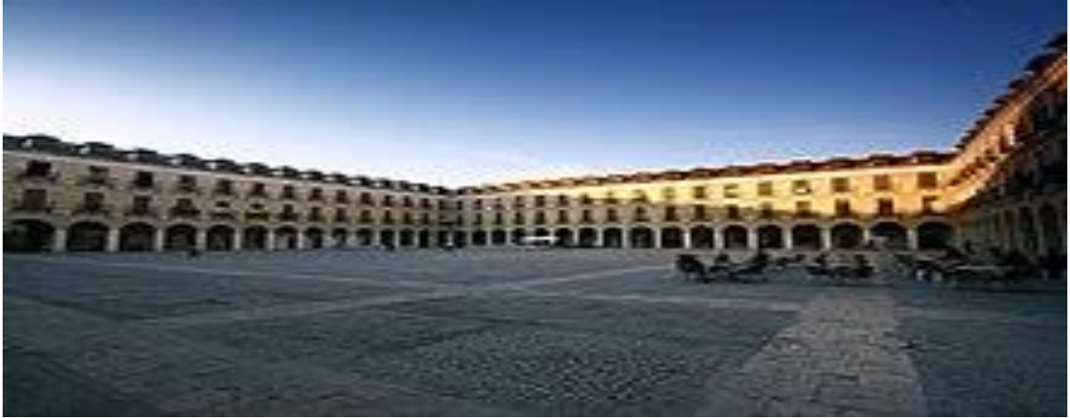
Ocaña plaza Mayor