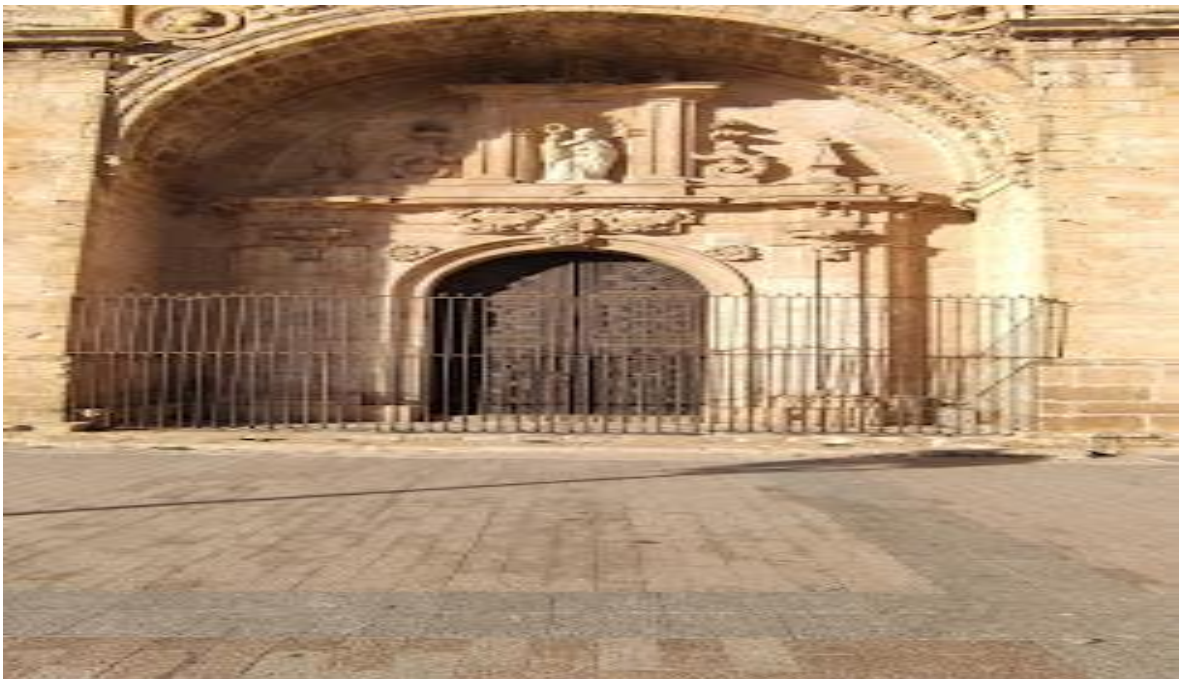
Colegiata de San Benito de Abad (YEPES)